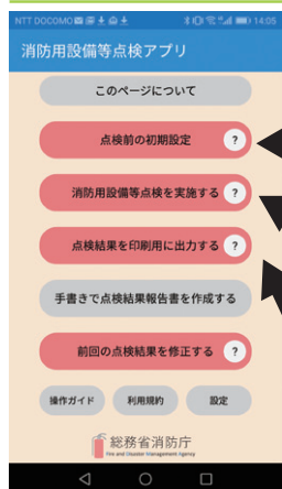
消防用設備等点検アプリ トップ画面